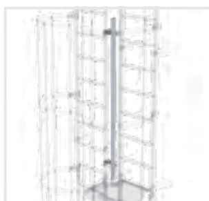
Abb. Bestell-Nr. 61274